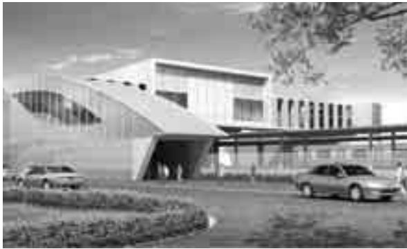
新駅駅舎のイメージ図