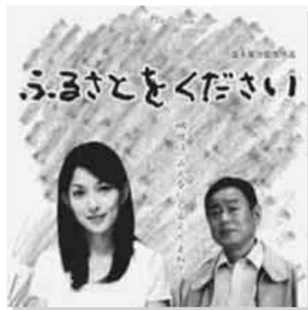
主催 映画「ふるさとをください」 上映実行委員会