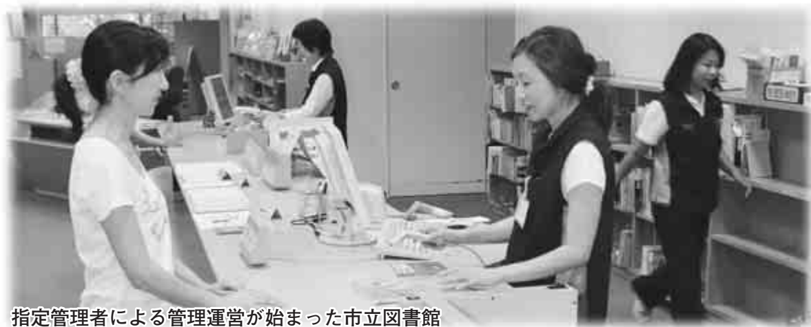
指定管理者による管理運営が始まった市立図書館

平成21年度の行財政改革と集中改革プラン（国が自治体に策定を求めた平成17年度から21年度までの5年間の行財政改革の計画）の成果がまとまりましたので、その概要をお知らせします。