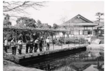
昼食は、花田苑(日本庭園)を眺めながら、こしがや能楽堂でいただきます。

日時 3月18日(火)午前10時20分～午後4時(予定) ※日程終了後、アンケートの記入をお願いします。 集合場所 市役所市民課玄関前 見学コース 市役所 → 環境センター → 花田苑 → 能楽堂(昼食) → 東埼玉資源環境組合 → 市役所 対象・定員 市内在住の方・30人(先着順) 費用 500円(昼食代) 申込・問合せ 2月10日(月)午前8時30分～21日(金)までに費用を添えて政策室へ直接、または電話で。政策室 直通☎982・5112 ※1グループ2人までの申し込みとします。