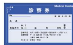
かかりつけ医の 診察券