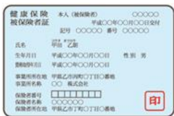
マイナ保険証 または 資格確認書