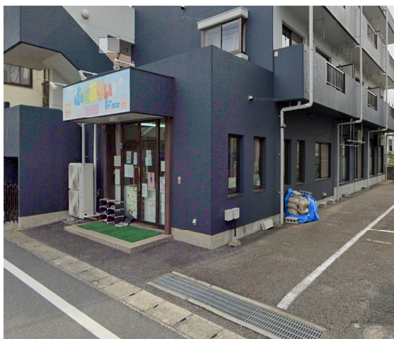
ふえありい保育園吉川美南園の外観