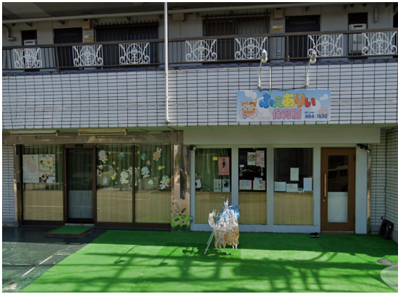
ふえありい保育園吉川園の外観