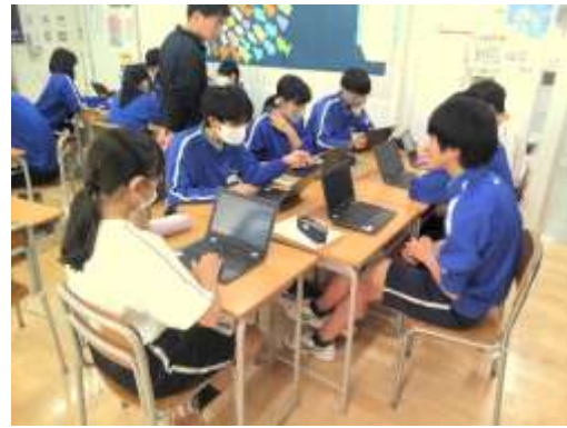
ICT機器を活用した授業