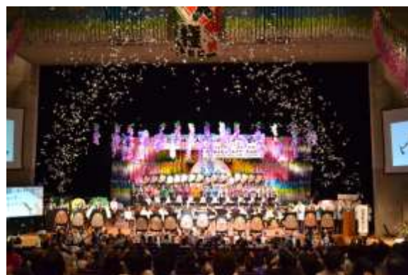
埼玉葛人権を考えるつどい

また、市人権教育推進協議会では、「女性の人権・子どもの人権部会」「高齢者の人権・障がい者の人権部会」「同和問題・外国人の人権部会」の3部会を設置し、6つの人権について人権教育啓発講座「人権セミナー」を企画し開催していきます。