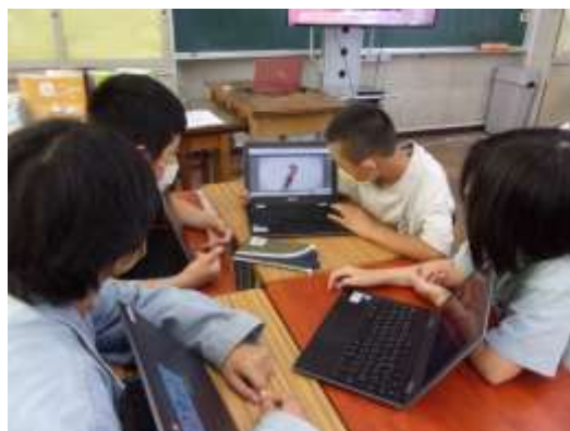
デジタルシティズンシップ教育の授業