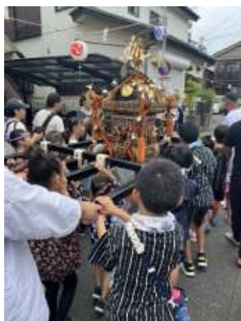
子ども神輿（美南・栄小）

子どもたちに様々な体験を通して「生きる力を育み、家庭・学校・地域社会が一体となって、地域で子どもを育てよう」という機運を醸成し、各小学校区の実行委員会が体験事業を提供し、奉仕活動・体験活動等を推進します。