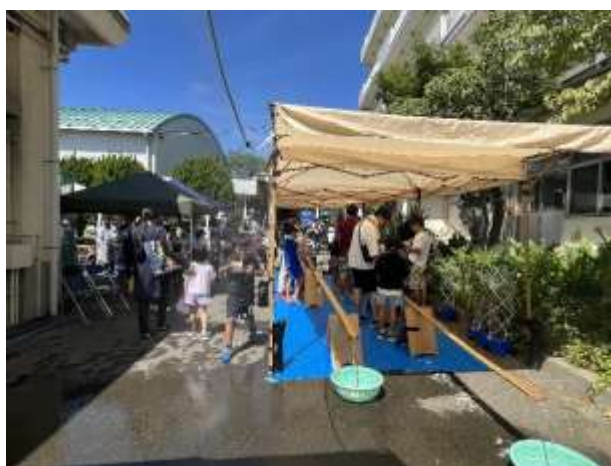
流しそうめん（北谷小）