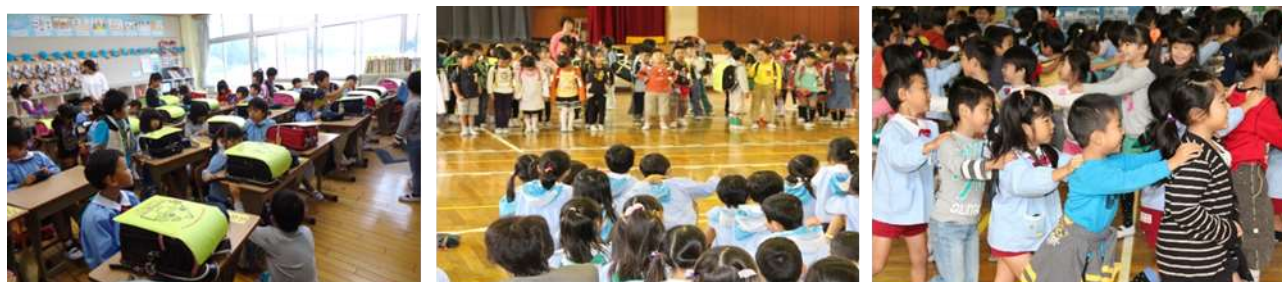
幼児と児童の交流活動の様子