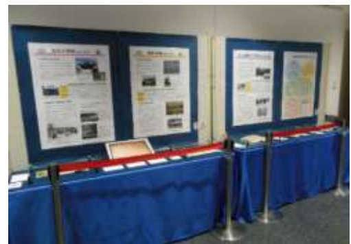
吉川市の文化財展(市役所内)

市の文化財及び関係資料を展示し、市民に広く周知・公開することにより、文化財保存に関する理解を深め、郷土愛の高揚を図ります。