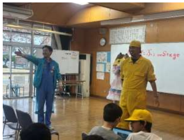
にゃんだぶう on Stage