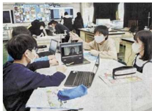
ALT とのオンラインブレンディット授業