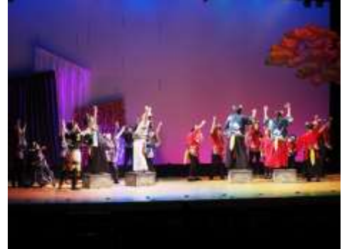
令和5年度公演「ばかされ～異聞吉川譚～」

子どもから高齢者、障がい者、外国人などの市民を中心に様々な参加者を募り、演劇公演を行います。また、参加者らにより、平和のつどいでの朗読劇を行うなど、文化芸術を総合政策として推進するための事業を展開していきます。