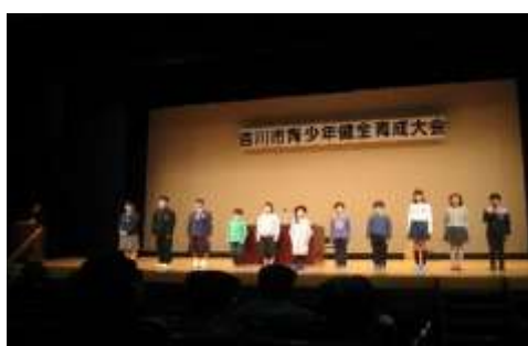
青少年健全育成大会の様子