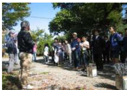
「クリーン作戦」活動の様子