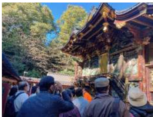
令和4年度特別講座（聖天山）