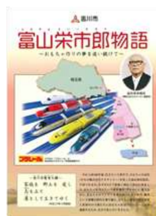
平成 29 年度から発行した各リーフレット(表紙)