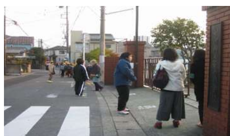
校門あいさつの様子