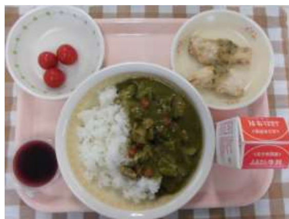
なまずの日献立（令和5年度）

「吉川産小松菜のグリーンカレー」「なまずの香草パン粉焼き」（小学校）「なまずのバジルソース」（中学校）