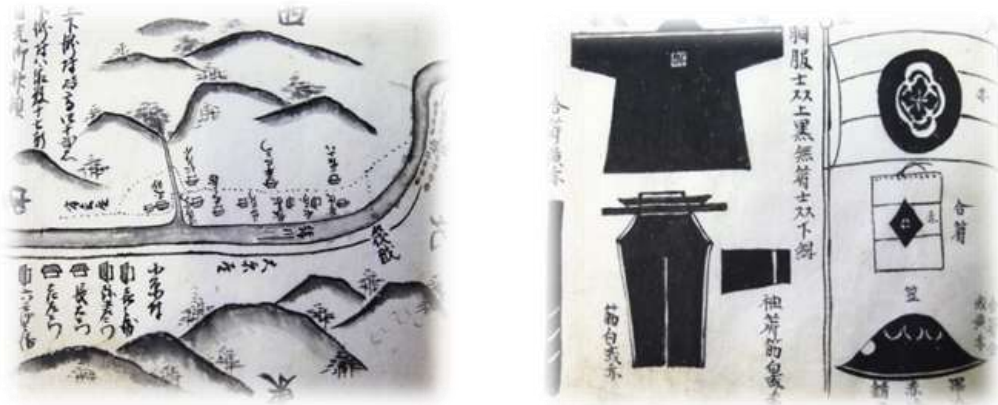
『慶応日記帳』より一部抜粋（イメージ）