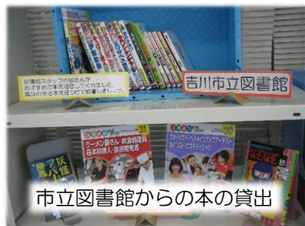
市立図書館からの本の貸出