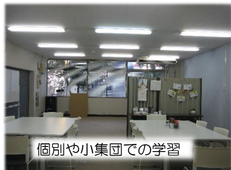
個別や小集団での学習