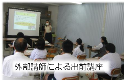
外部講師による出前講座