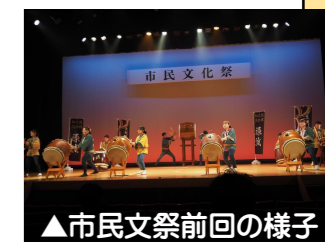
▲市民文祭前回の様子