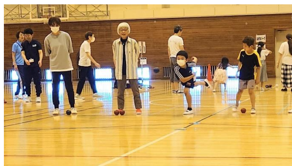
スーパーショット炸裂？！