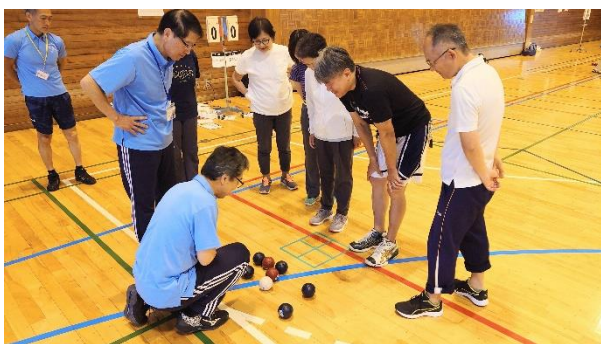
どの試合も僅差の接戦