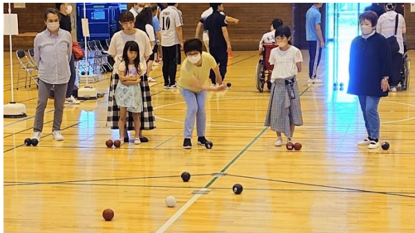
幅広い世代で交流しつつポッチャを楽しみました！