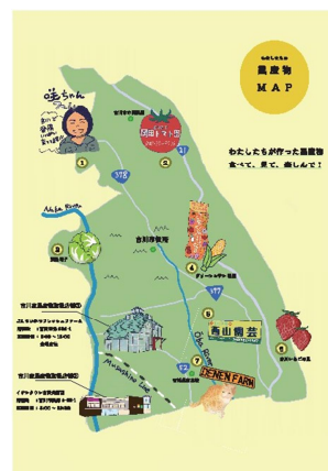
配布予定の農産物マップ