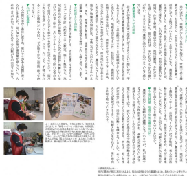
展示予定のパネル