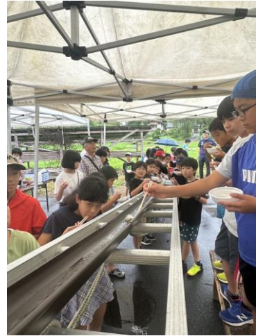
流しそうめんの様子