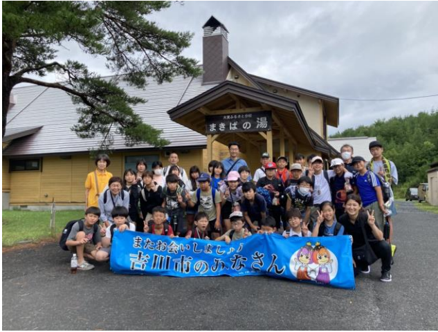
室根町の宿泊施設での記念写真