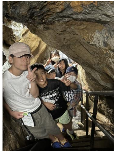
日本最古の鍾乳洞である、幽玄洞を見学