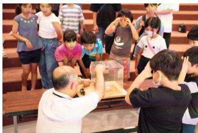
熱心に実験を見る子どもたち

日時 7月30日午後1時30分～3時 場所 児童館ワンダーランド(美南5-3-1) 内容 電気の安全な使い方の学習、レモン電池の製作など 参加 18名(小学校1年生から6年生まで) 協力 一般財団法人関東電気保安協会埼玉事業本部