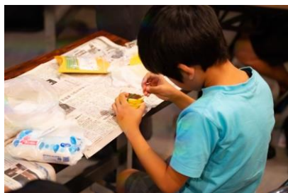
レモン電池の製作の様子