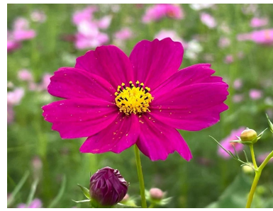
コスモス畑の様子(10月7日撮影)