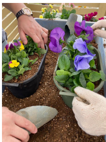
花卉農家で体験できる「花壇苗の寄せ植え体験」