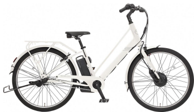
世界初!一回の充電で約1,000キロ走行可能な「Re:BIKE」