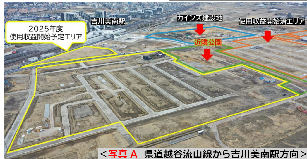
<写真 A 県道越谷流山線から吉川美南駅方向>