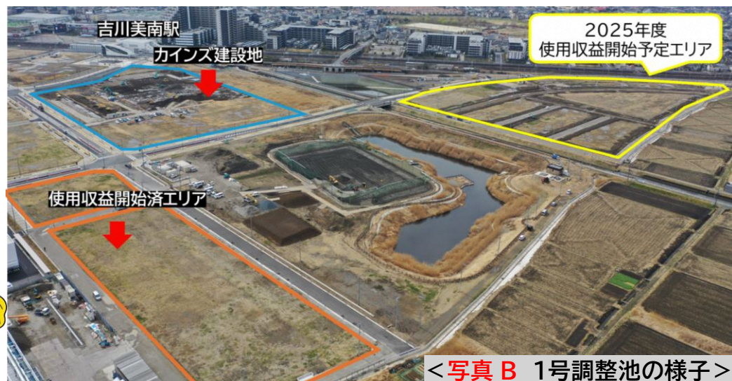
<写真 B 1号調整池の様子>