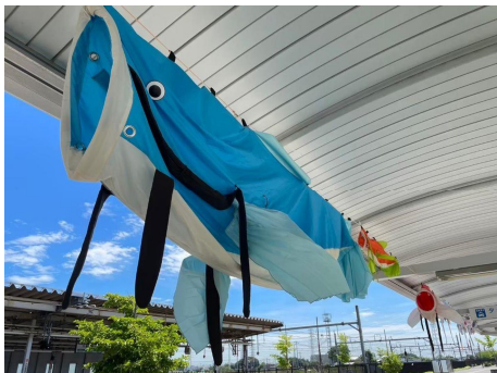
JR 吉川美南駅西口ロータリーの様子