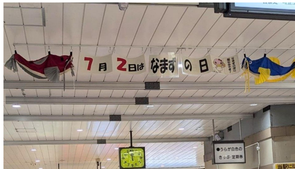
JR 吉川駅改札の様子