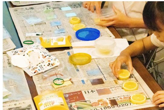
レモン電池の作製