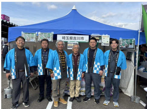
農協職員と市内の生産者さん

吉川市の販売ブースでは、「吉川ねぎ」と昨年に引き続き「ねぎバッグ」を販売し、「吉川ねぎ」は2日目の午前中には完売するほど大好評でした。