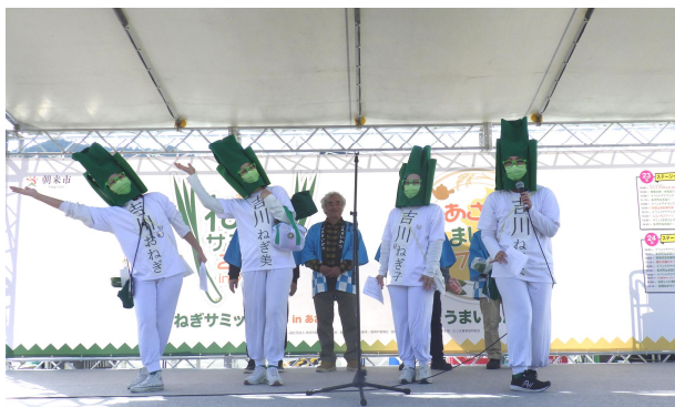
PR合戦では、ネギシスターズと市内の生産者さんが、圧倒的な存在感を魅せつけました