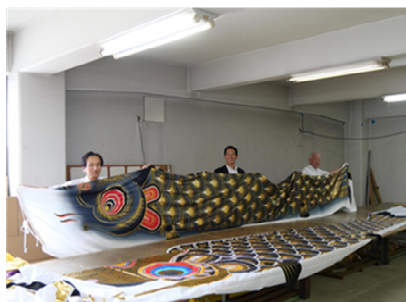
加須市内で作られた鯉のぼり