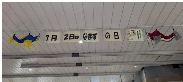
JR 吉川駅改札の様子