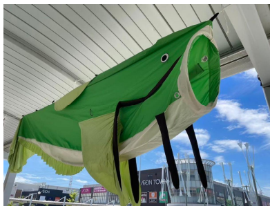
JR 吉川美南駅西口ロータリーの様子