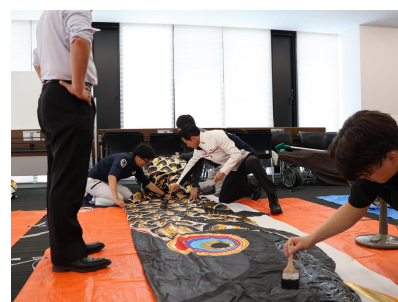
鯉のぼりからなまずのぼりへ