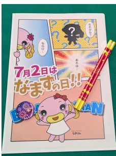
配布する「えんぴつ」、「缶バッジ」、「紙製クリアファイル」(写真は昨年のももの)

※市外の小学校に通う児童には、市役所商工課、市民交流センターおあしす、中央公民館にて配布いたします。