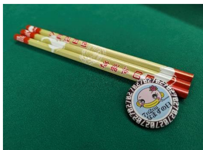
配布する「えんぴつ」と「缶バッジ」(写真は昨年のも)

※市外の小学校に通う児童には、市役所商工課、市民交流センターおあしす、中央公民館にて配布いたします。