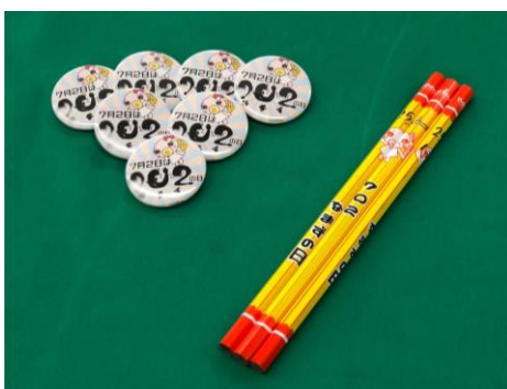
配布する「えんぴつ」と「缶バッジ」