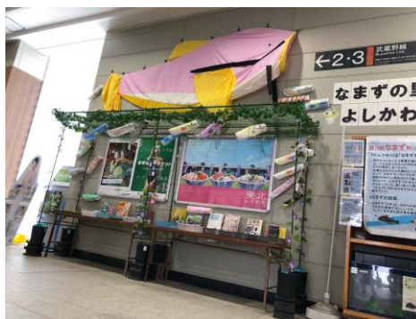
吉川美南駅構内の様子