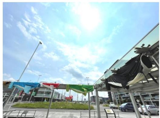
吉川美南駅西口ロータリーに展示されたなまずのぼり（参考：昨年度）