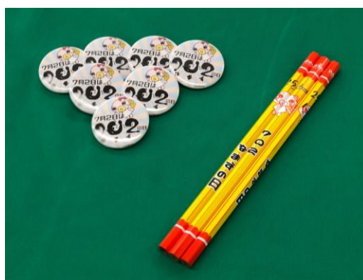
缶バッジと鉛筆（参考：昨年度）