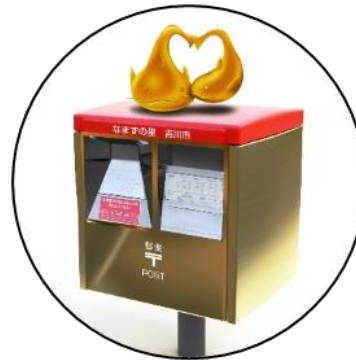
オリジナルポスト完成予想図