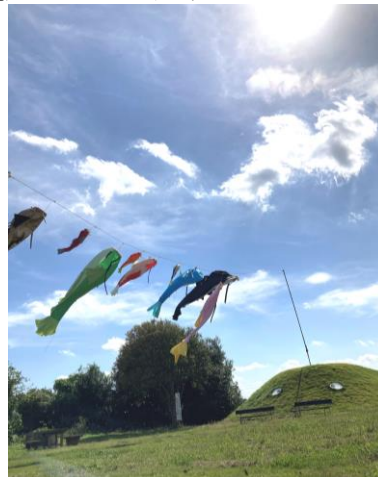
市民農園の様子(昨年)