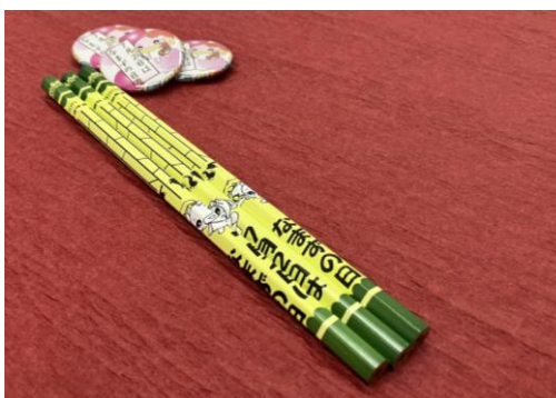
「えんぴつ」と「缶バッジ」(昨年)