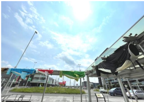
吉川美南駅西口ロータリーの様子(昨年)

(2) 展示場所 ①吉川美南駅構内②吉川美南駅西口ロータリー ③吉川駅改札前④市民農園