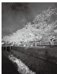
昨年の関公園周辺での桜のライトアップ

市内では、さくら通りをはじめ、各所で桜を楽しむことができます。桜の開花に合わせて、よしかわ観光協会では、関公園周辺と中川台で桜のライトアップを実施します。また、毎年、各地域で催しやライトアップなどが行われます。