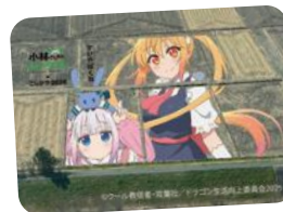
今年度こしがや田んぼアートの完成イメージ