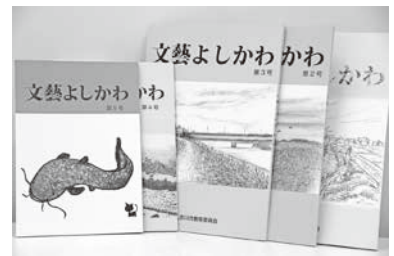
文藝よしかわ第1号から第5号は生涯学習課窓口で絶賛発売中!