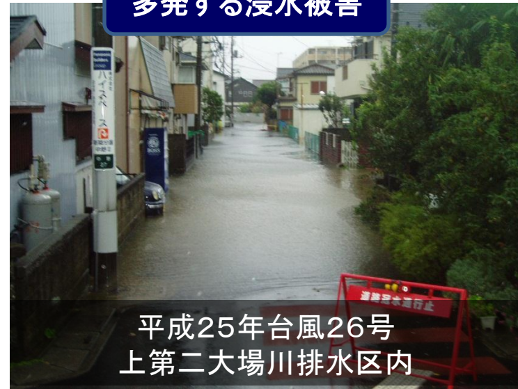
平成25年台風26号 上第二大場川排水区内