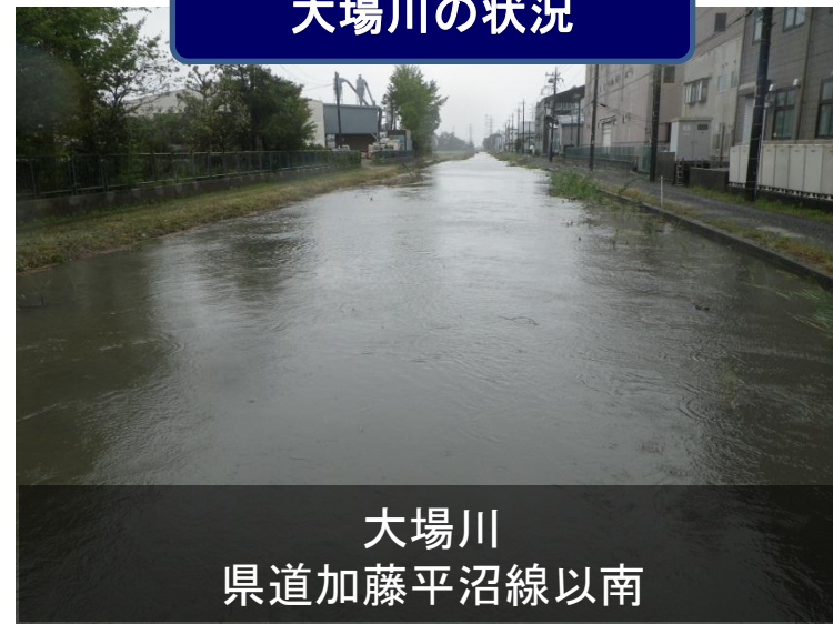
大場川 県道加藤平沼線以南