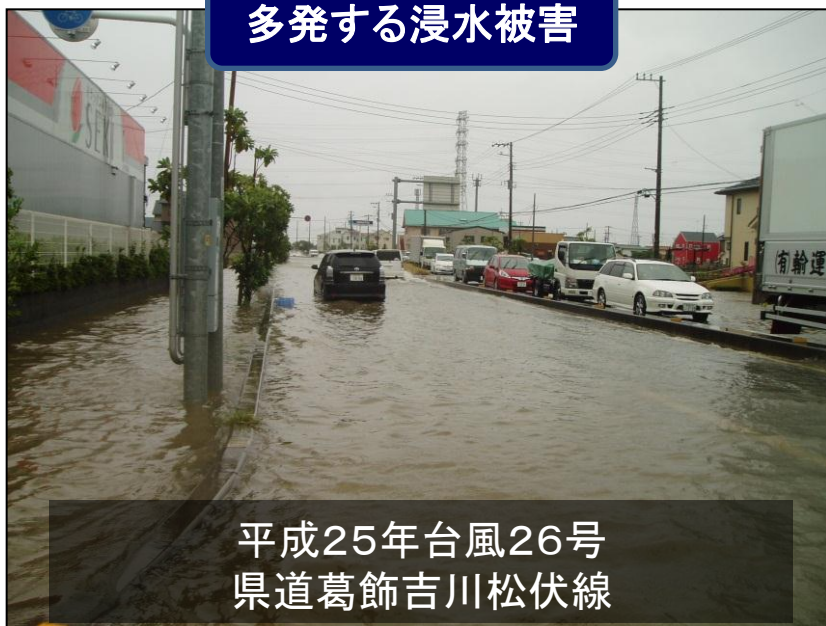
平成25年台風26号 県道葛飾吉川松伏線