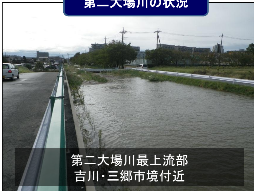
第二大場川最上流部 吉川・三郷市境付近

(赤): 事業中、またはすぐに事業着手可能な施策 (緑): 検討のうえ事業化を目指す施策 (青): 事業が完了した施策