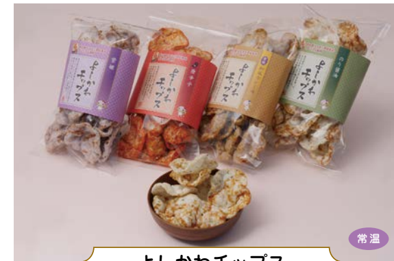
よしかわチップス

「なまずの里よしかわ」を感じさせる、なまずの形をしたかわいらしいお煎餅。全8種類(醤油・胡麻・海苔・ごらめ・抹茶・味噌・唐辛子・黒米)の豊富なバリエーション。さくっと軽い食感がたまらない。創業当時から厳選した食材を使用し、こだわりの製法で丁寧に焼き上げた本格派のお煎餅は、手軽なお土産やご挨拶にも喜ばれる。埼玉県ふるさと認証食品のプレミアム認証を取得。