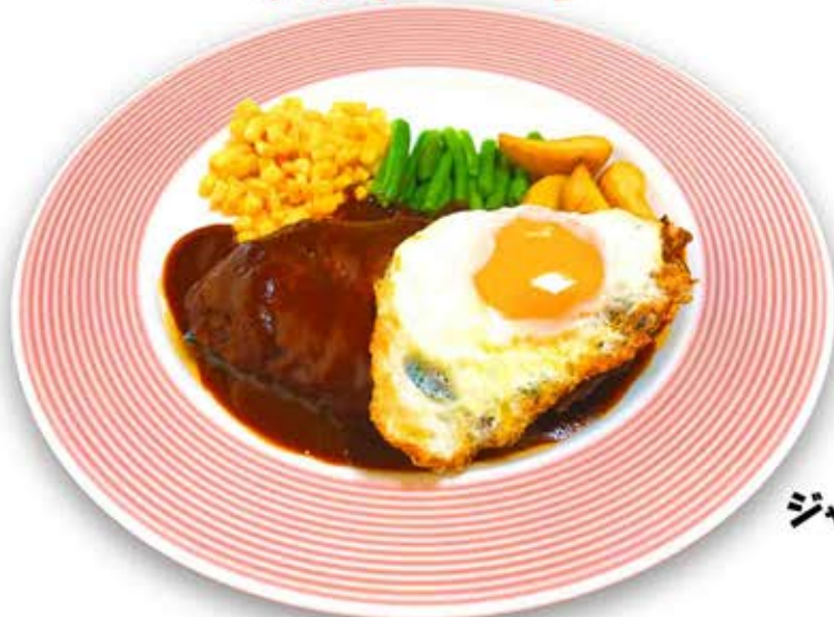
ジャンボハンバーグステーキ