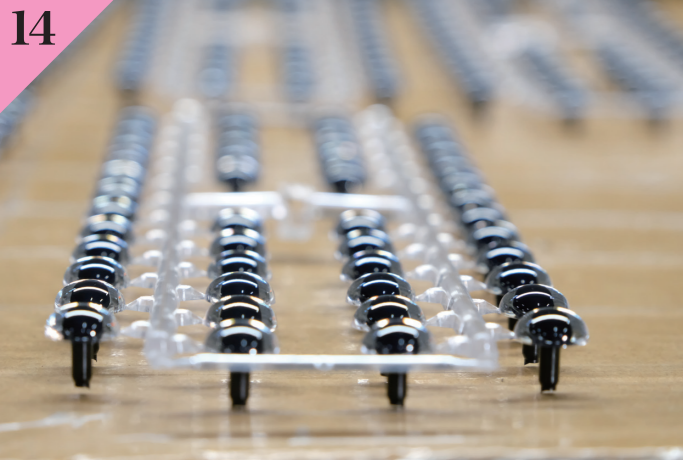
創立以来、作り続けている人形、動物、キャラクターなどぬいぐるみの目玉。ここで命が吹き込まれます。