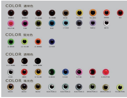
目玉の色見本。大ききや組み合わせなど目玉のバリエーションは計り知れない。