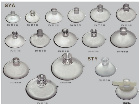
吸着盤の見本。大きさ、色、穴があるかないか等、やはりそのバリエーションは非常に豊富。