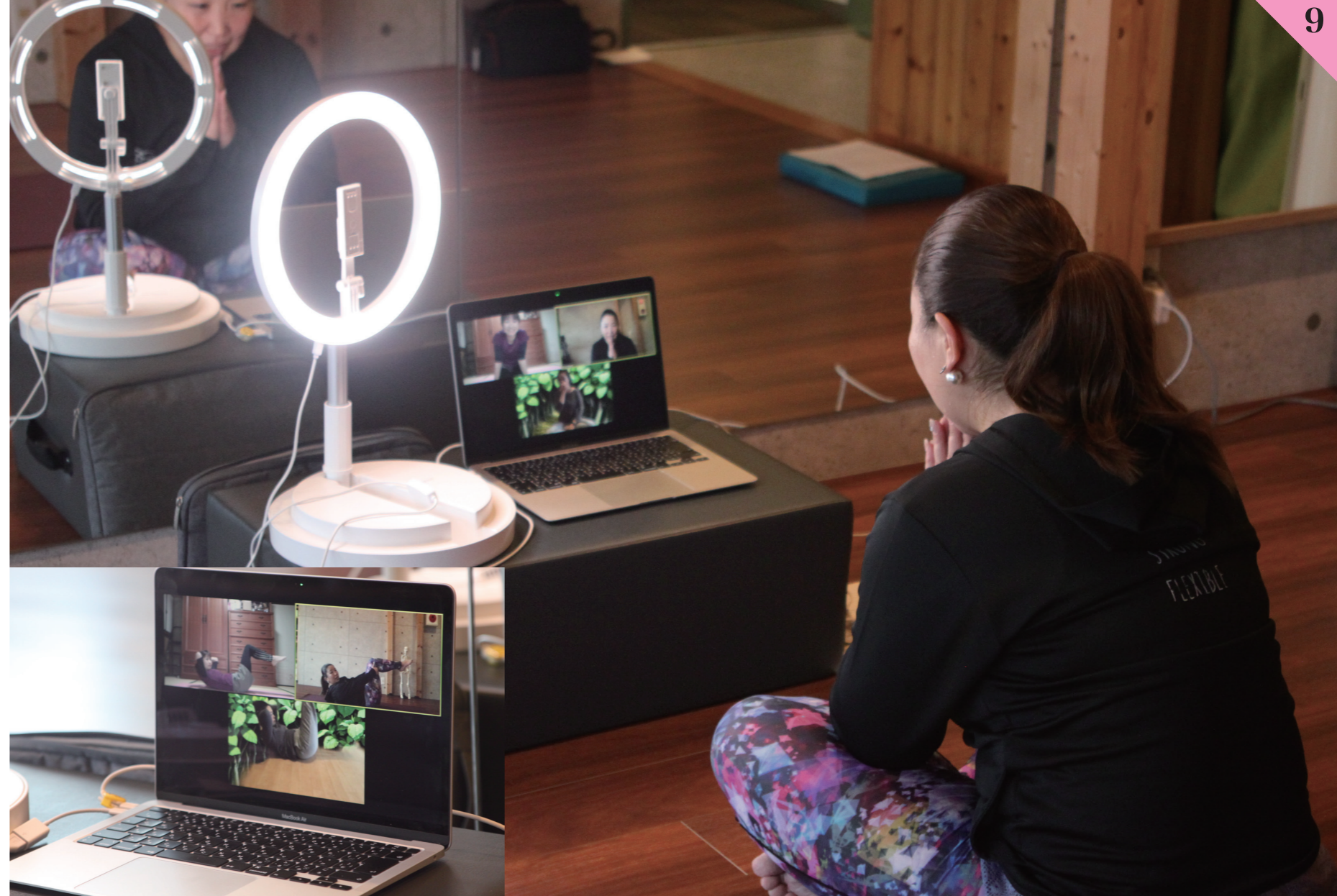
パソコンを使っってのオンラインレッスン。生徒さんたちと繋がりがコミュニケーションを取れる喜びをあらためて実感した。

などが騒がれていたため、その打撃は大きかったです。まずは特に換気などを気を付けようという入口には新しく網戸を設置しました。その時期は編戸の引き合いが多かったようでした。置までに結構時間がかかりました。 また、緊急事態宣言中は、パソコンを使ってオンラインレッスンをを行いました。オンラインレッスンをやったことで、事業を続けられたこともよかったです。ですが、皆さん家にこもりっぱなしだったので、生徒さんと繋がりが、コミュニケーションをとることで、心のバランスをとるお手伝いが出来たことがうれしかったです。」