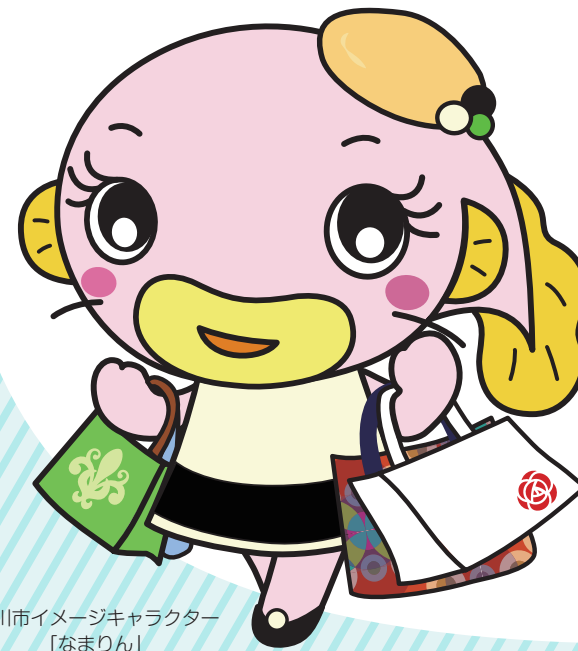
吉川市イメージキャラクター 「なまりん」