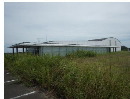
大高島水防センター