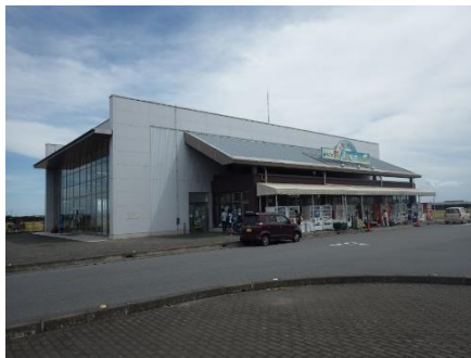
上新郷水防センター