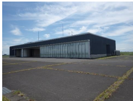
新川通水防センター