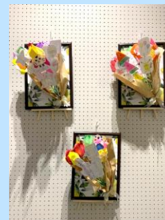
←【吉川市長賞】 「HANATABA」 吉川フレンドパーク 就労継続B型事業