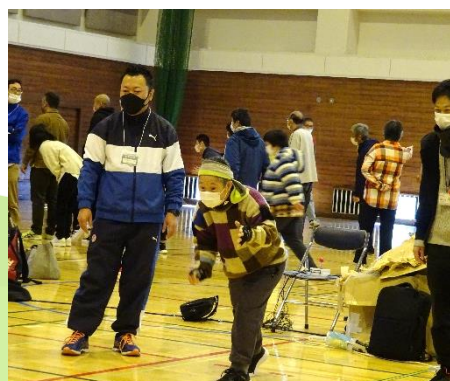
①⑥の写真 去年の屋内スポーツ大会の様子(ポッチャ)

主催 吉川市 後援 吉川市手をつなぐ育成会 開催日 令和5年12月3日（日曜日）午前9時から正午まで 開催場所 吉川市総合体育館 大会議室 内容 ポッチャ、ふうせんバレー、ダンスなど ※障がい者アート展受賞作品の展示や、障がい福祉施設の製品販売もあります。 対象者 障がいのあるなしに関わらず、小さなお子様からお年寄りの方まですべての方 問合せ 障がい福祉課 電話048-982-5238