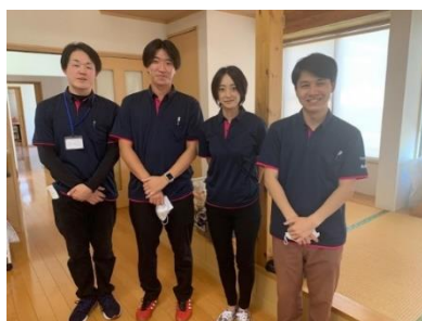
スタッフの皆さん

開設日 令和3年8月1日 場所 吉川市大字川野75番地2 問合せ電話 048-972-6922