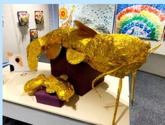
←【優秀作品賞】 「真・金のなまず」 生活介護事業所 よりみちA