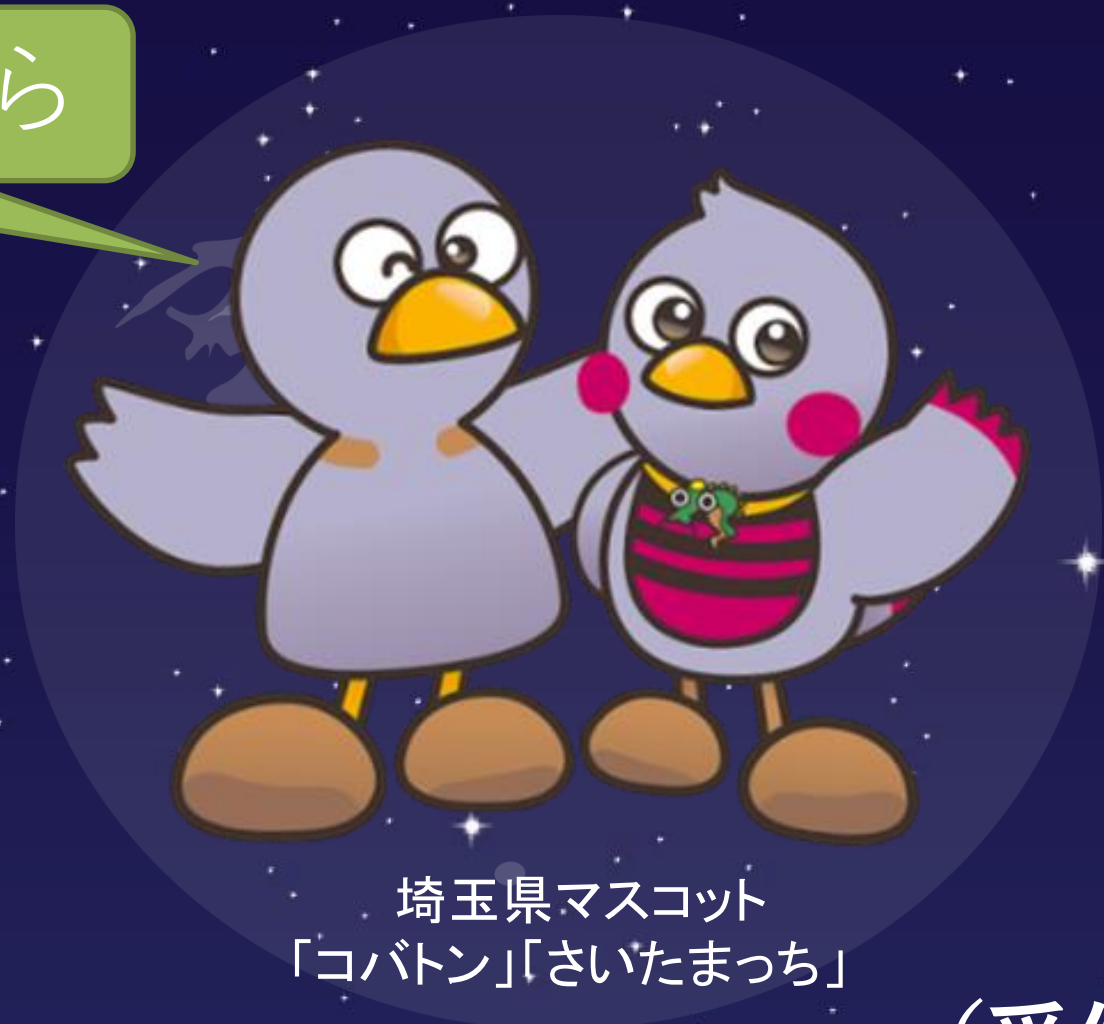
埼玉県マスコット 「コバトン」「さいたまっち」