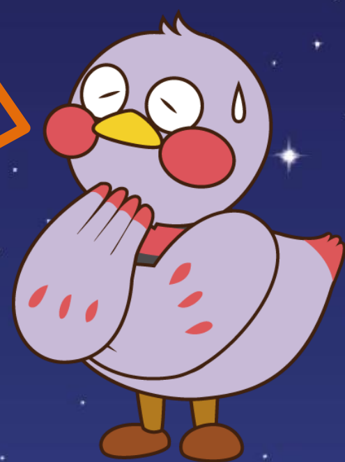
埼玉県マスコット 「さいたまっち」

こころに関する相談内容を何でも受け付けます。 悩みがあれば気軽に相談してみてください！