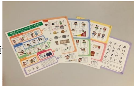
コミュニケーションボード