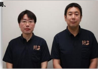
吉川駅前郵便局 吉川平沼郵便局

外で迷子になっていたお子さんを見つけてこられたお客様が郵便局へご案内してくださいました。お子さんが不安にならないよう社員が話しかけ、その間に警察に連絡する等の対応をしました。その後、無事に親御さんのもとへ帰られました。