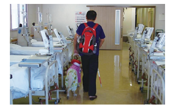
透析室では、透析が終わるまで盲導犬はベッドの横でおとなしく待機。