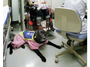
診察室では、じゃまにならないよう介助犬は足もとで待機。（附属病院）