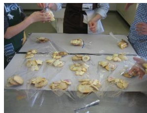
エコ・クッキング