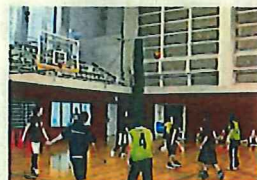
バスケットボール教室