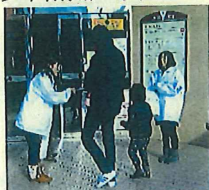
「家庭の日」の啓発活動の様子