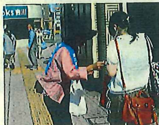
「非行防止強化月間」の啓発の様子