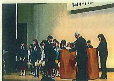
第32回青少年健全育成大会（標語発表・表彰）