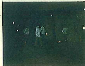
夜の補導活動の様子