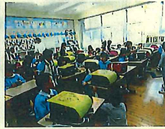
新1年生の情報交換