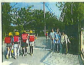
昼の補導校門あいさつの様子