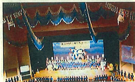
埼玉人権を考えるつどい