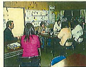
補導のミーティングの様子