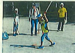
グラウンドゴルフ大会