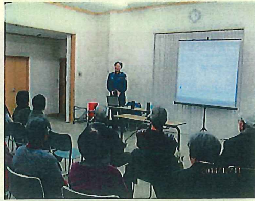
出 前 講 座