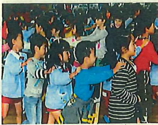
担当者研修会の開催