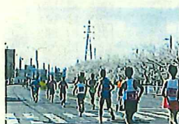
なまずの里マラソン