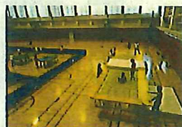
なまずの里クラブ