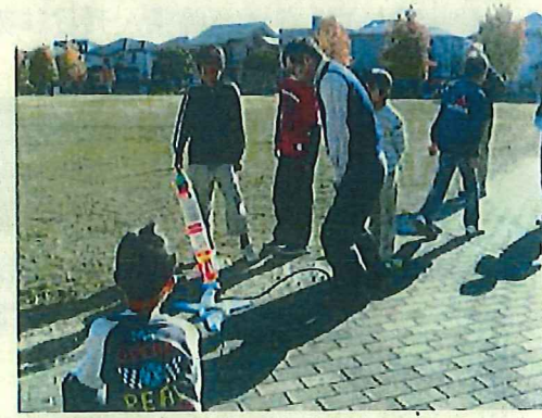
吉川さいえんすクラブ