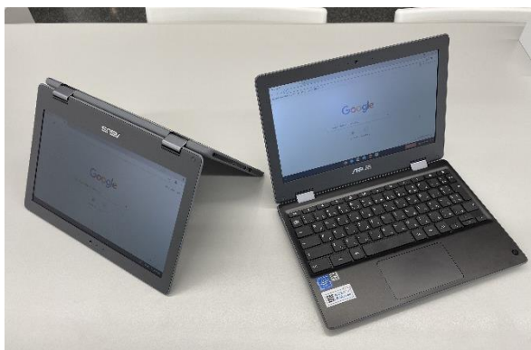
1人に1台配備された「Chromebook」