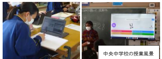
↑デジタル教科書には、先生がテレビ等に映す「指導者用」と、児童生徒がタブレット端末で見る「学習者用」がある。