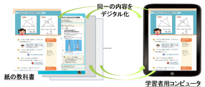
図1 ＜学習者用デジタル教科書＞

市としては、今後到来するデジタル教科書本格導入に向けて、沢山使うことで様々な課題を発見し、より良い利活用の方法を考えていくことが大切であると考えています。