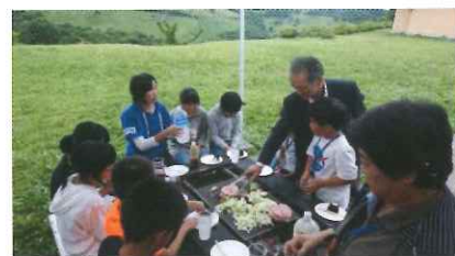
夕食は室根の子ども達と 一緒にバーベキュー

2日目は午前中、室根神社から室根山の頂上まで登山をしました。登山前には室根神社の鐘を撞いて遊ぶ姿も。頂上まで約30分登ると、疲れた事もふっとぶ青い空と気仙沼や太平洋まで見渡せるきれいな景色が待っていました。その後「アストロロマン大東」に移動し竹を磨き、麺を茹でて、流しそうめんを楽しみました。午後は水質が良い事で有名な津谷川で川遊びとイカダ体験を楽しみました。その後昨日も立ち寄った「道の駅むろね」でお土産タイム。夕食はカレーを食べました。楽しみにしていた星空観察は天気が悪く観察できませんでしたが、子ども達は肝試しなどで最後の夜を楽しみました。