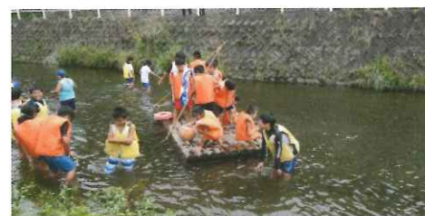
今年も大人気！川遊び！！

3日目は仲良くなった室根の小学生とお別れセレモニーを行いました。その後、「幽玄洞」という鍾乳洞を見学しました。ヒンヤリした鍾乳洞で冷やされたスイカも頂きました。その後、新幹線で一関をあとにしました。台風接近が心配されましたが、大自然を満喫した思い出深い3日間となりました。