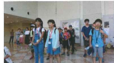
来年もまた行きたい！