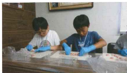
みんな真剣な表情で 鶏肉に串を刺しました