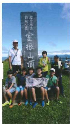
室根山からの眺 めは最高でした