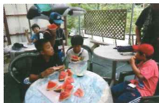
洞窟で冷やしたスイカ