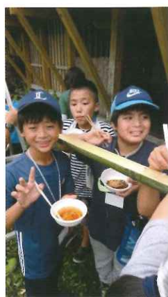
流しそうめんを 大満喫♪♪