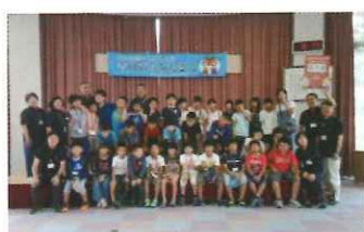
お別れセレモニー

3日目は仲良くなった室根の小学生とお別れセレモニーを行いました。その後、「幽玄洞」という鍾乳洞を見学しました。ヒンヤリした鍾乳洞で冷やされたスイカも頂きました。その後、新幹線で一関をあとにしました。台風接近が心配されましたが、大自然を満喫した思い出深い3日間となりました。