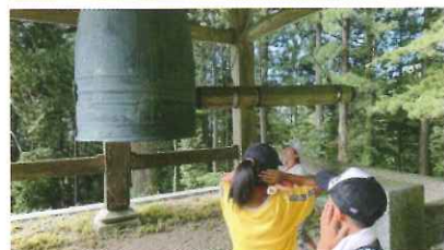
室根神社の大きな鐘の音にびっくり

2日目は午前中、室根神社から室根山の頂上まで登山をしました。登山前には室根神社の鐘を撞いて遊ぶ姿も。頂上まで約30分登ると、疲れた事もふっとぶ青い空と気仙沼や太平洋まで見渡せるきれいな景色が待っていました。その後「アストロロマン大東」に移動し竹を磨き、麺を茹でて、流しそうめんを楽しみました。午後は水質が良い事で有名な津谷川で川遊びとイカダ体験を楽しみました。その後昨日も立ち寄った「道の駅むろね」でお土産タイム。夕食はカレーを食べました。楽しみにしていた星空観察は天気が悪く観察できませんでしたが、子ども達は肝試しなどで最後の夜を楽しみました。