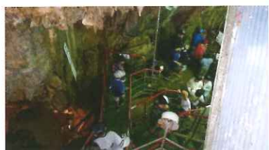
幽玄洞の気温はヒンヤリ13度