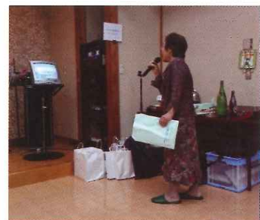
総勢72名が参加し、盛大に行われました