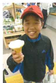
「道の駅むろね」では ソフトクリームをプレゼントされました