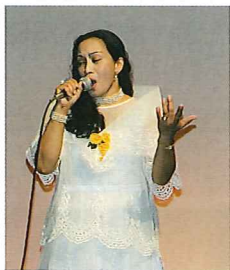
英語 日本語 タガログ語の歌