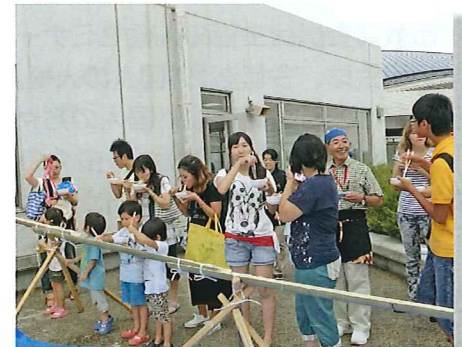
夏まつり 流しそうめん 2013.8.31