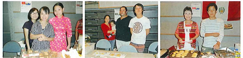
世界10ヶ国の料理を1品100円で提供