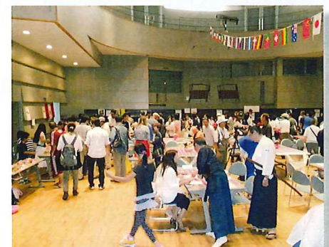
インターナショナルフレンドシップ パーティー 2013.9.29