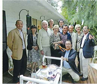
元市長ビル・克蘭マー宅ディナー