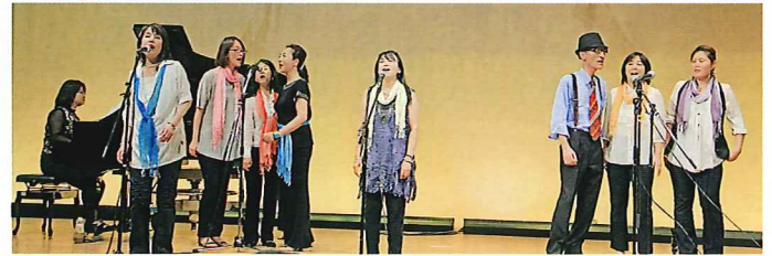
ジャズ&ポップスコラース