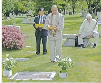
故アリス・シュレンカー元市長墓前参拝