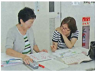
ボランティアスタッフ養成講座 毎年9月頃

ボランティアスタッフも大歓迎です。異文化交流に興味のある方は是非お越しください。