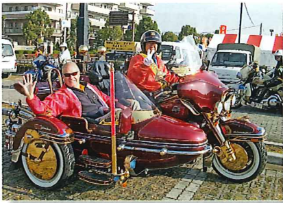
市民まつり 姉妹都市から初参加 2013.11.17