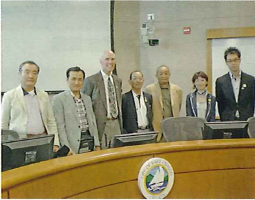
ケント・スチュードベイカー市長を訪問

戸張市長は今回12年ぶりの訪問との事でしたが、一緒に訪問して下さった事により、姉妹都市友好交流が、より実りある発展につながった、と強く感じた訪問でした。