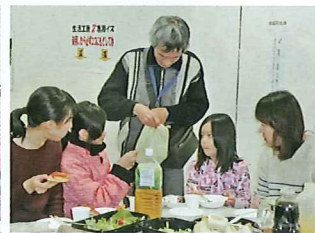
年末最終回、パーティと年賀状づくり