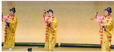
沖縄舞踊 ていーだの会