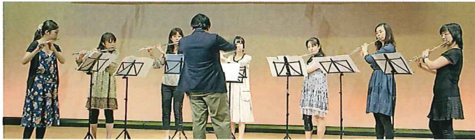
初出場 「アンサンブルで社会貢献」の皆さん