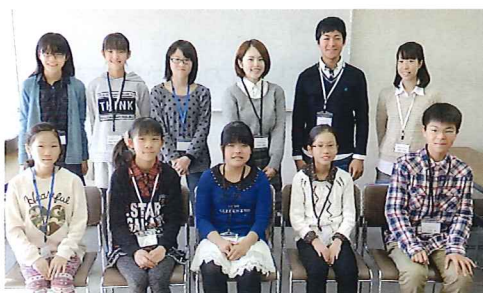
今春の青少年親善訪問団参加予定者