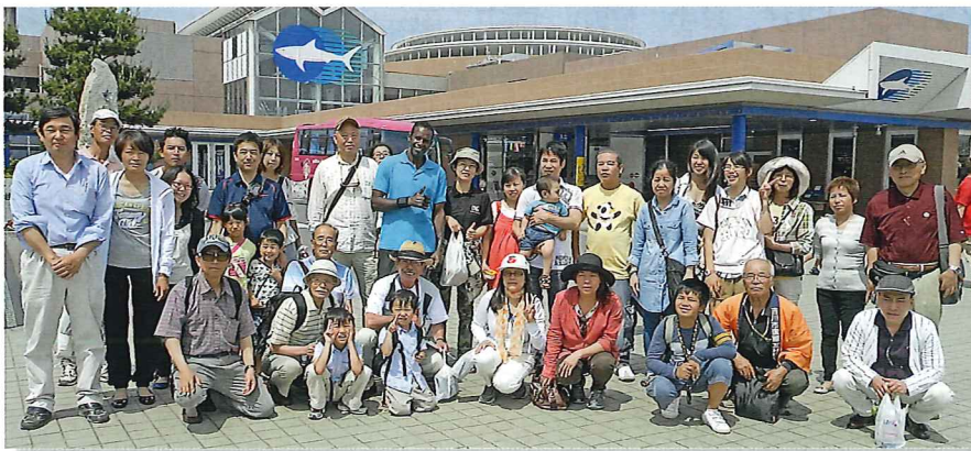
バスハイク 大洗水族館 2013.6.9