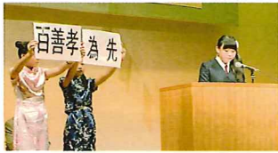
日本語学習者のスピーチ