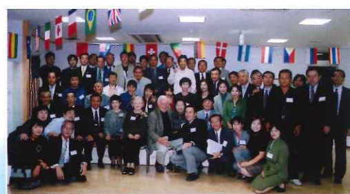
レイクオスエゴ元市長ビル夫妻歓迎会

2000年(H12年) ◆吉川市民：約57,000人 ◆市在住外国人：約580人