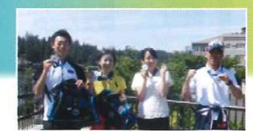
なまずの里マラソンからレイクランへの派遣選手

2010年(H22年) ◆吉川市民：約66,000人 ◆市在住外国人：約960人