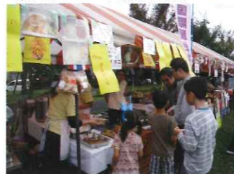
市民まつり・国際屋台村