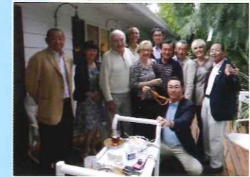
市民訪問団 LO市長夫妻とビルさん宅にて

2010年(H22年) ◆吉川市民：約66,000人 ◆市在住外国人：約960人