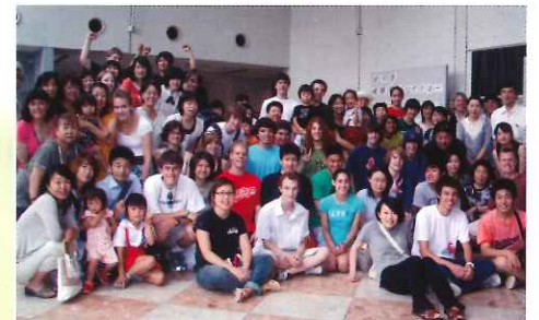
レイクオスエゴ市の高校生ホームステイ受入れ