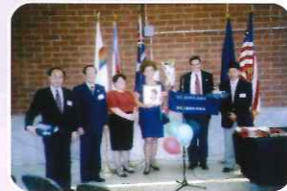
↑LO市と友好提携 ↓レイクラン派遣選手