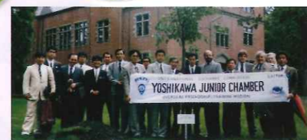
青年会議所オレゴン交流

2005年(H17年) ◆吉川市民：約60,000人 ◆市在住外国人：約690人