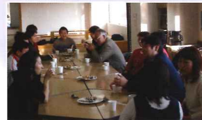
自由なしゃべり場「オープンサロン」