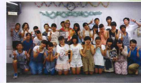
ハイジ先生と英語クラブの皆さん