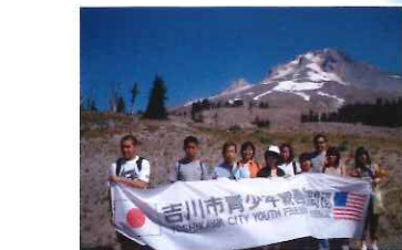
夏に実施された青少年親善訪問団