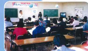
カルチャーリレー