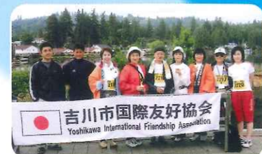
LO市への市民訪問団「レイクツアー」