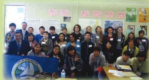
青少年親善訪問団 とレイクリッジ高校生(2015年4月)