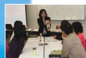
↑スタッフ養成講座 ↓日本語教室 ↑バスハイク

2000年(H12年) ◆吉川市民：約57,000人 ◆市在住外国人：約580人