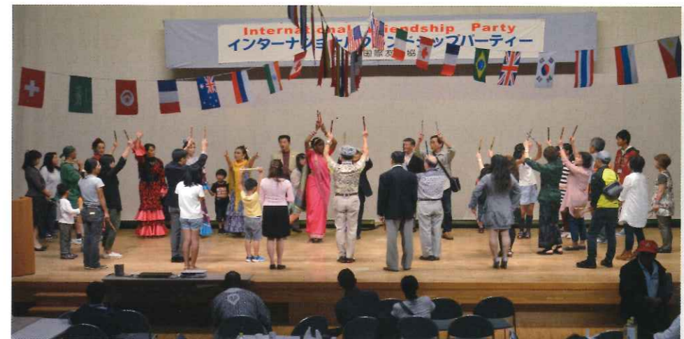
昨年9月27日(日)、市長、議長、教育長を始め歴代の会長、近隣の国際交流団体の方々を来賓に迎え、盛大に開催されたIFPの様子