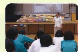
ゲストティーチャー