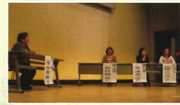
男女共同参画フォーラム