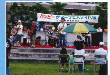
ハッピーサマーフェスティバル