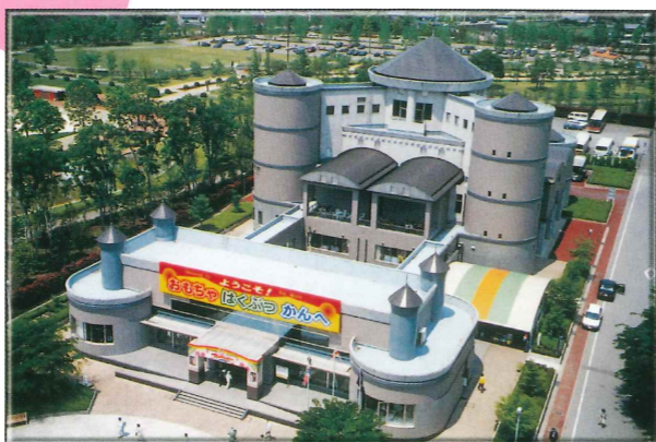
壬生町おもちゃ博物館 くにや (壬生町国谷)

平成7年(1995)に開館しました。約9千点のおもちゃを展示しています。さわって遊べるスペースもあり、幼児から大人まで楽しめる施設です。