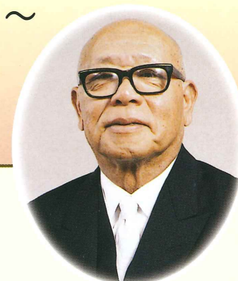
富山栄市郎氏 (株式会社タカラトミー創業者)