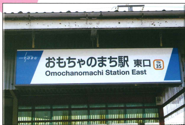
おもちゃのまち駅 しもつがくみぶまち (栃木県下都賀郡壬生町)

おもちゃ団地の建設に合わせ、昭和40年(1965)、東武鉄道宇都宮線に「おもちゃのまち駅」が開業しました。駅の名前は栄市郎が考えました。