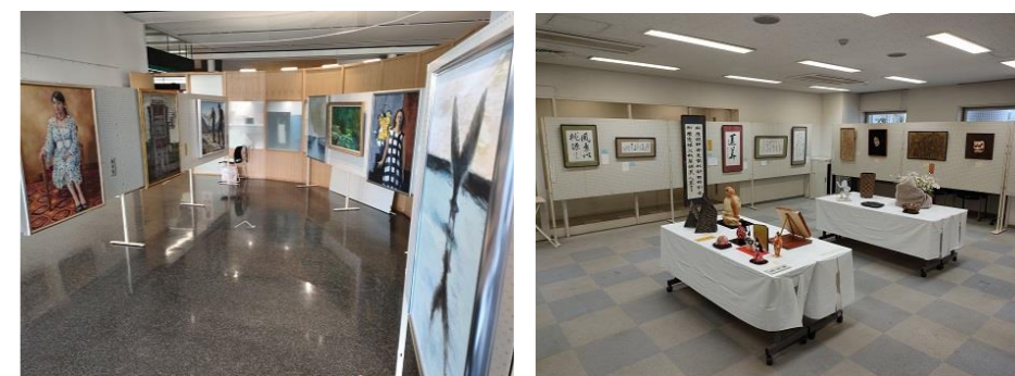
第1回吉川市美術展覧会（市展）