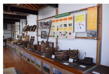
郷土資料館展示の様子