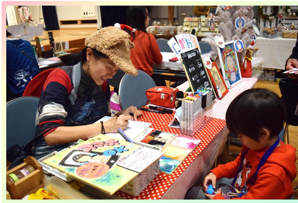
クリスマスフェスタ (平成28年12月6日、市民交流センターおあしすホール) 主催：NPO法人 To Going Concern for Women、共催：吉川市

男女共同参画は、全ての人に、そして、仕事、家庭、地域生活などのあらゆる場面に関わっています。吉川市男女共同参画啓発紙では、すべての男女が自分らしく生きることのできるまちをめざし、様々なテーマを取り上げて情報発信していきます。今回のテーマは「多様な働き方」です。